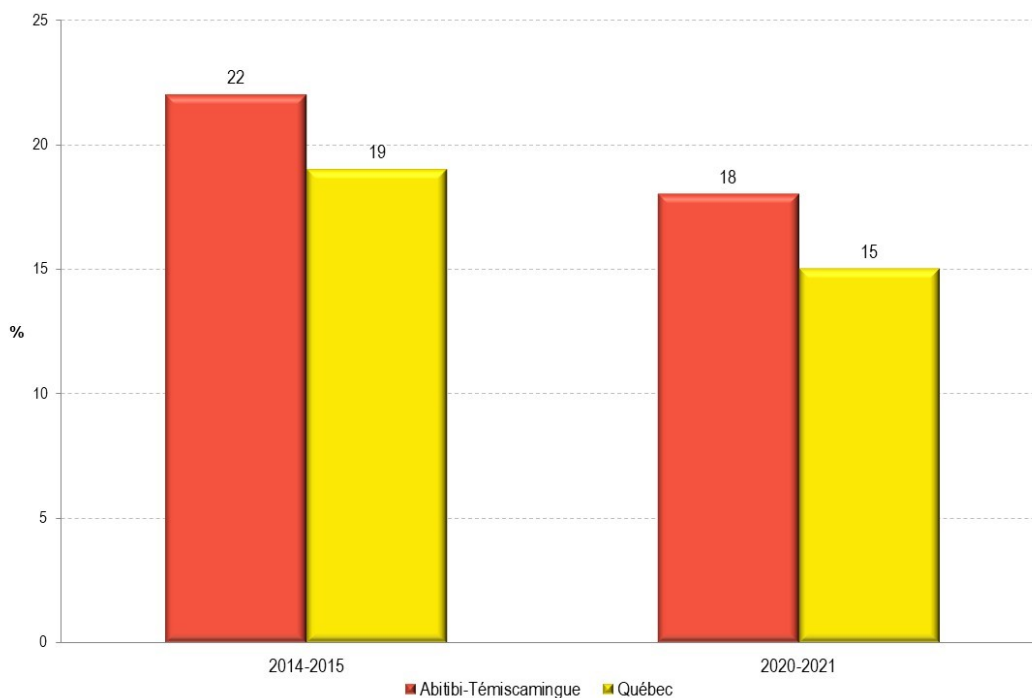
Proportion (%) de personnes de 15 ans et plus, sexes réunis, fumant tous les jours ou occasionnellement, Abitibi-Témiscamingue et Québec 2014-2015 et 2020-2021