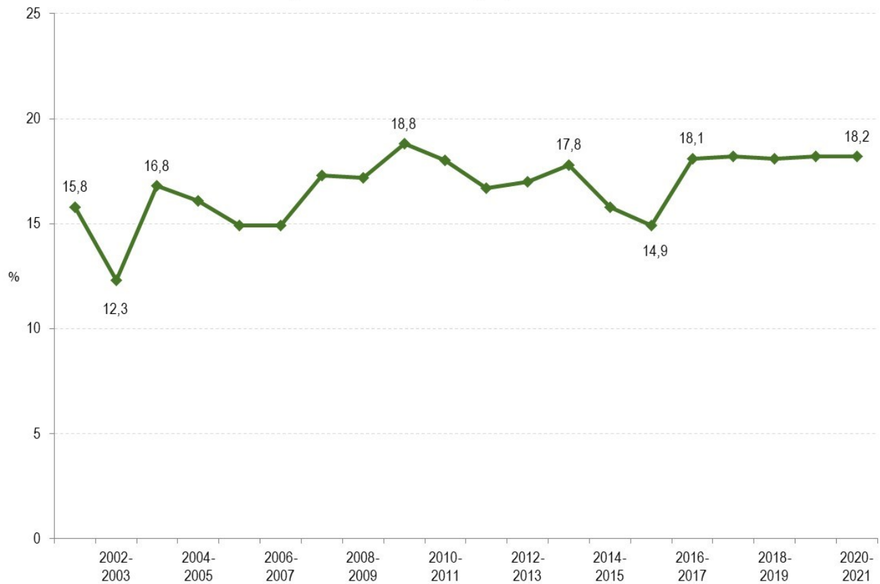
Proportion (%) d'élèves handicapés ou en difficulté d'adaptation ou d'apprentissage, sexes réunis, MRC de Témiscamingue, 2001-2002 à 2020-2021