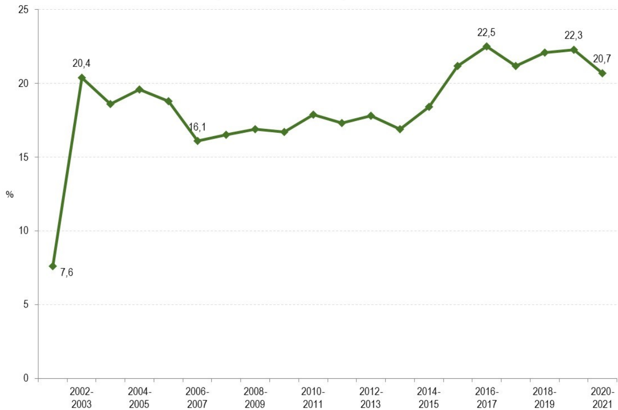
Proportion (%) d'élèves handicapés ou en difficulté d'adaptation ou d'apprentissage, sexes réunis, MRC d'Abitibi-Ouest, 2001-2002 à 2020-2021