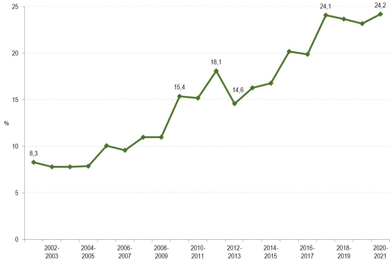
Proportion (%) d'élèves handicapés ou en difficulté d'adaptation ou d'apprentissage, sexes réunis, MRC d'Abitibi, 2001-2002 à 2020-2021