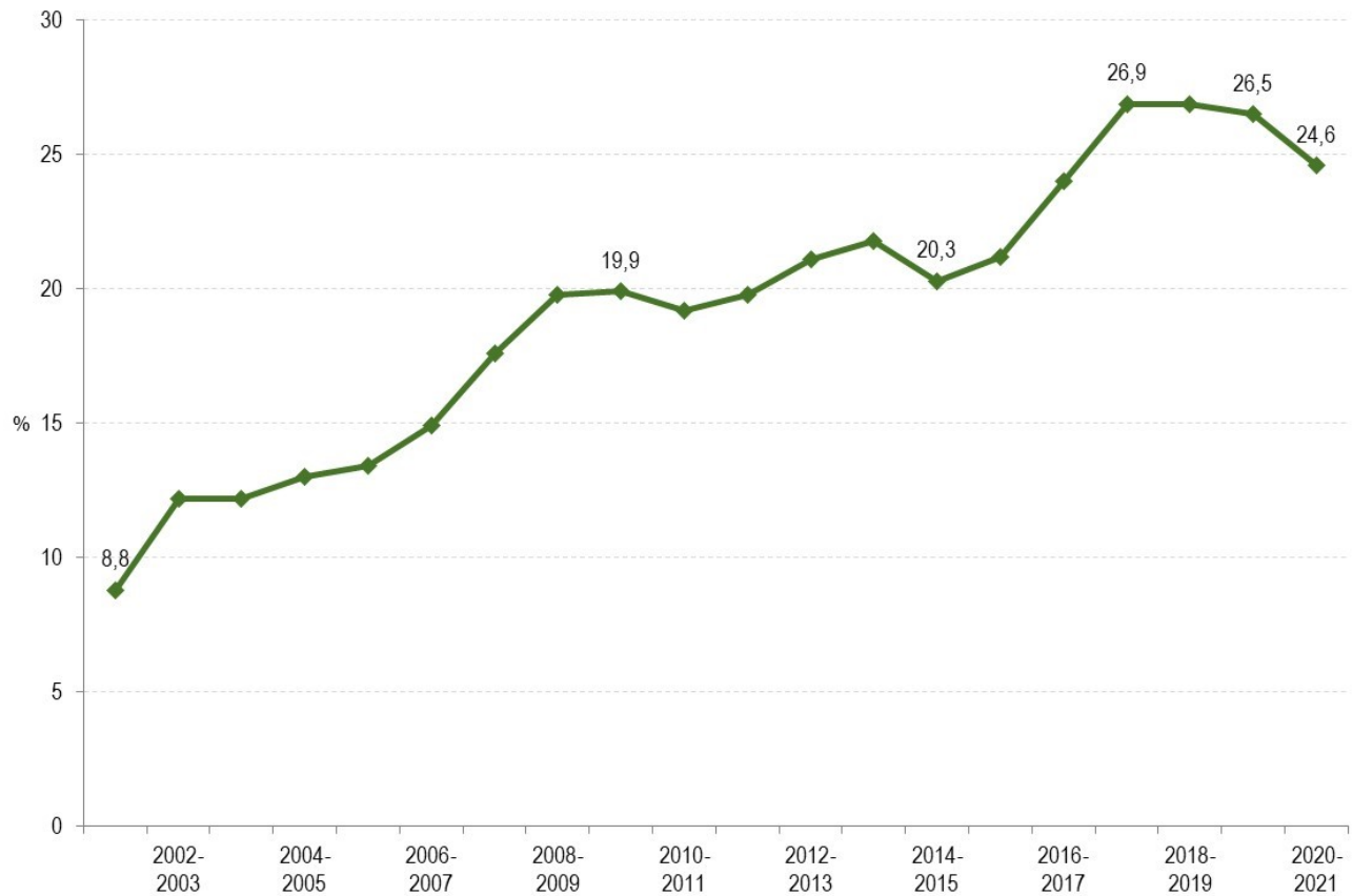
Proportion (%) d'élèves handicapés ou en difficulté d'adaptation ou d'apprentissage, sexes réunis, MRC de la Vallée-de-l'Or, 2001-2002 à 2020-2021