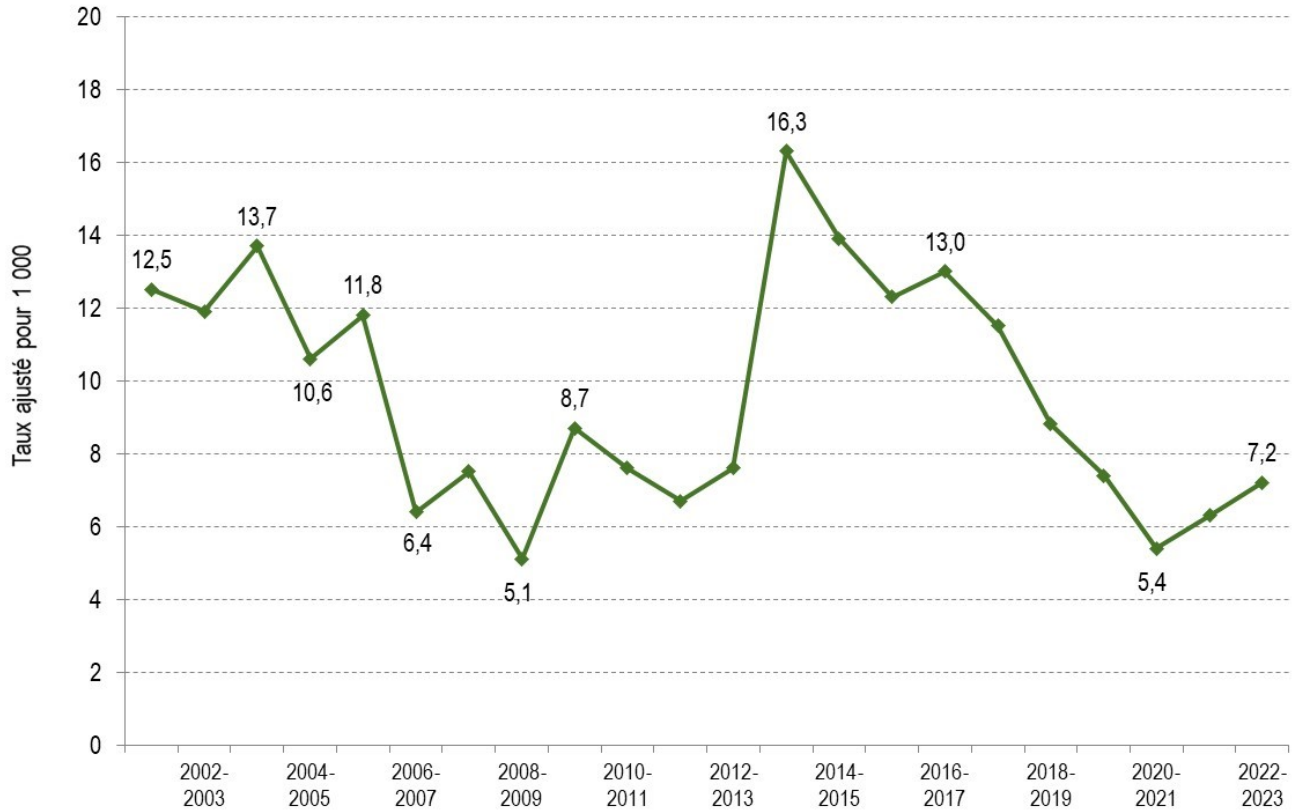
Taux d'incidence de la maladie pulmonaire obstructive chronique (MPOC) parmi la population âgée de 35 ans et plus, MRC d'Abitibi, 2001-2002 à 2022-2023