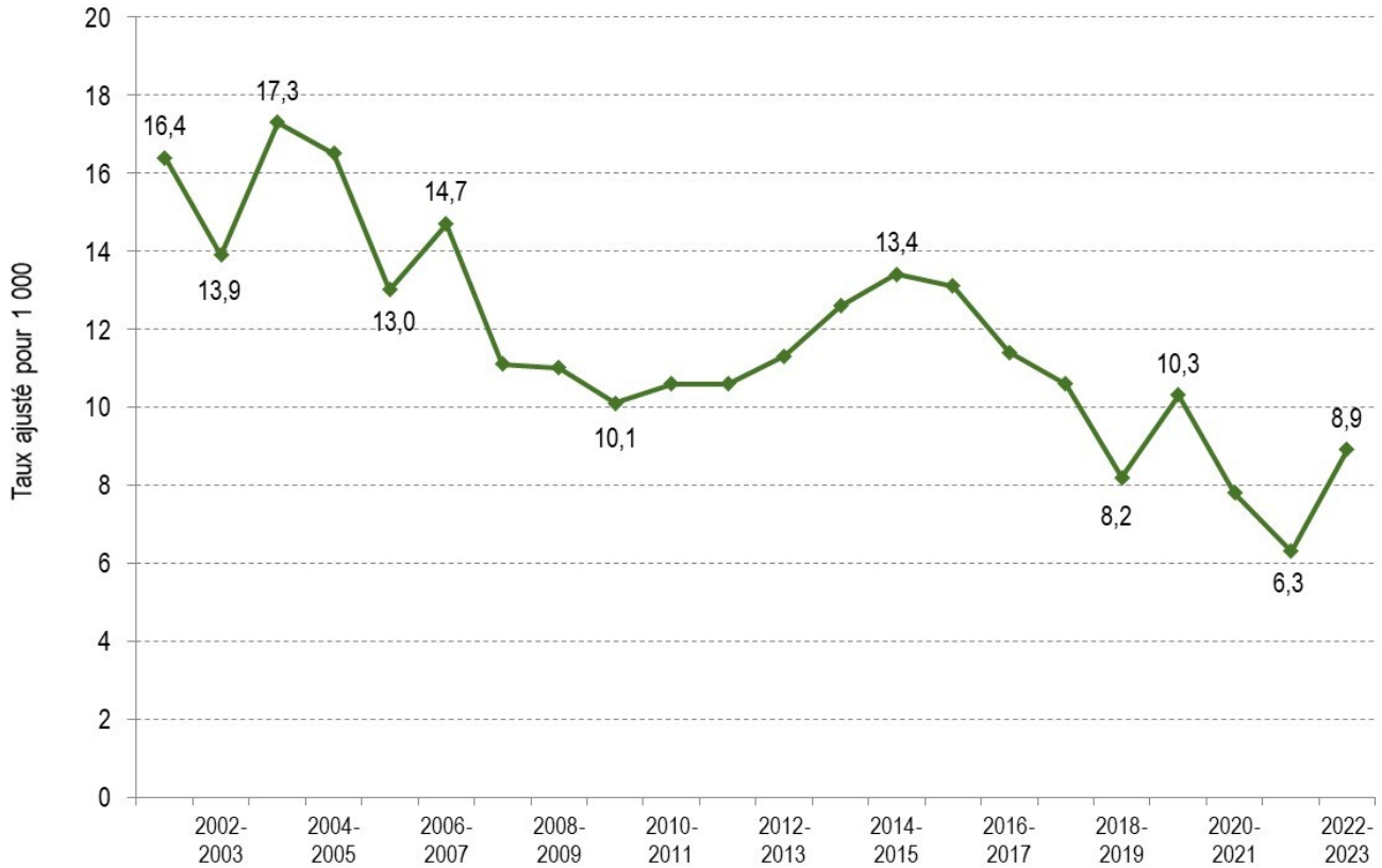
Taux d'incidence de la maladie pulmonaire obstructive chronique (MPOC) parmi la population âgée de 35 ans et plus, MRC d'Abitibi-Ouest, 2001-2002 à 2022-2023