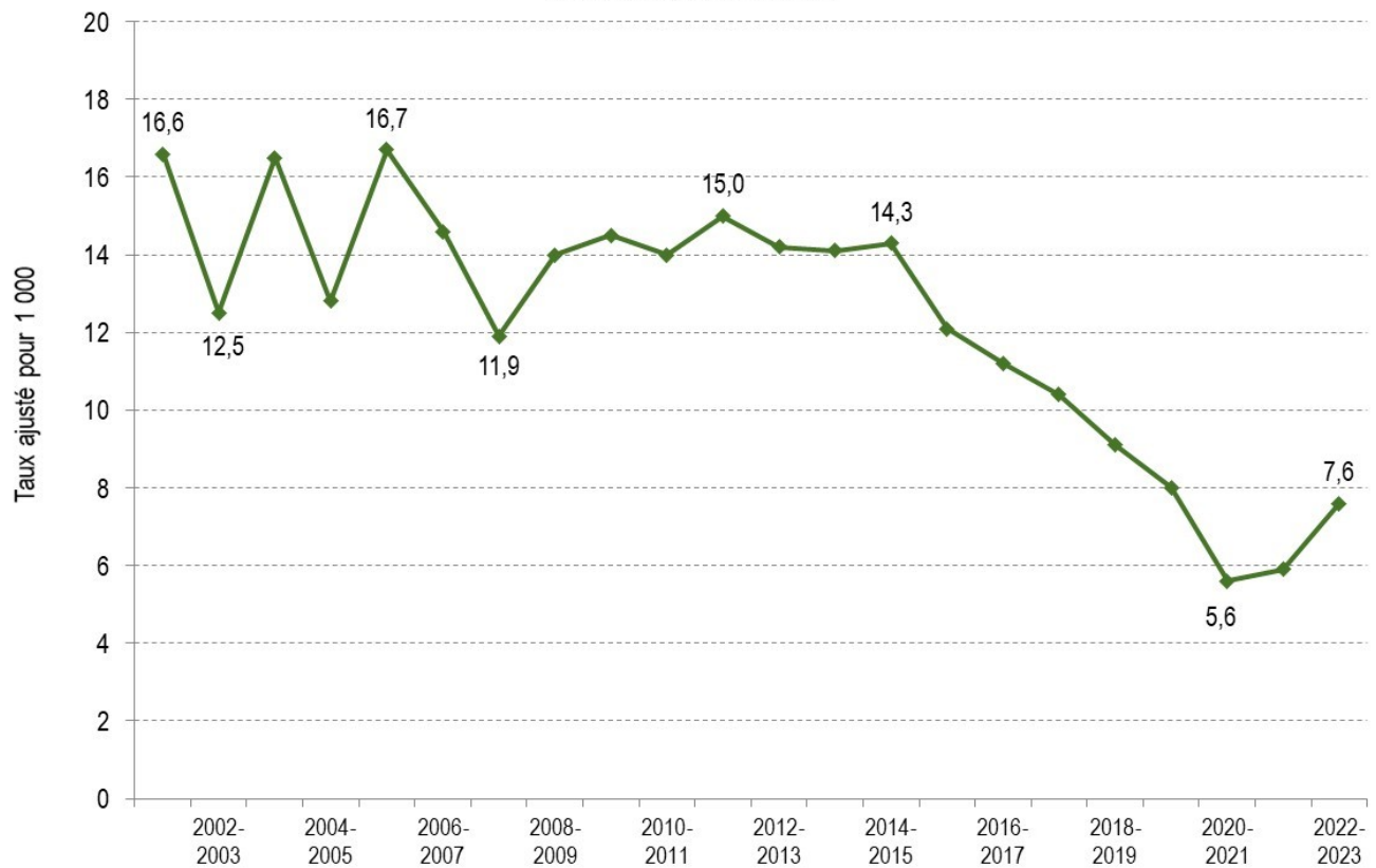
Taux d'incidence de la maladie pulmonaire obstructive chronique (MPOC) parmi la population âgée de 35 ans et plus, Ville de Rouyn-Noranda, 2001-2002 à 2022-2023