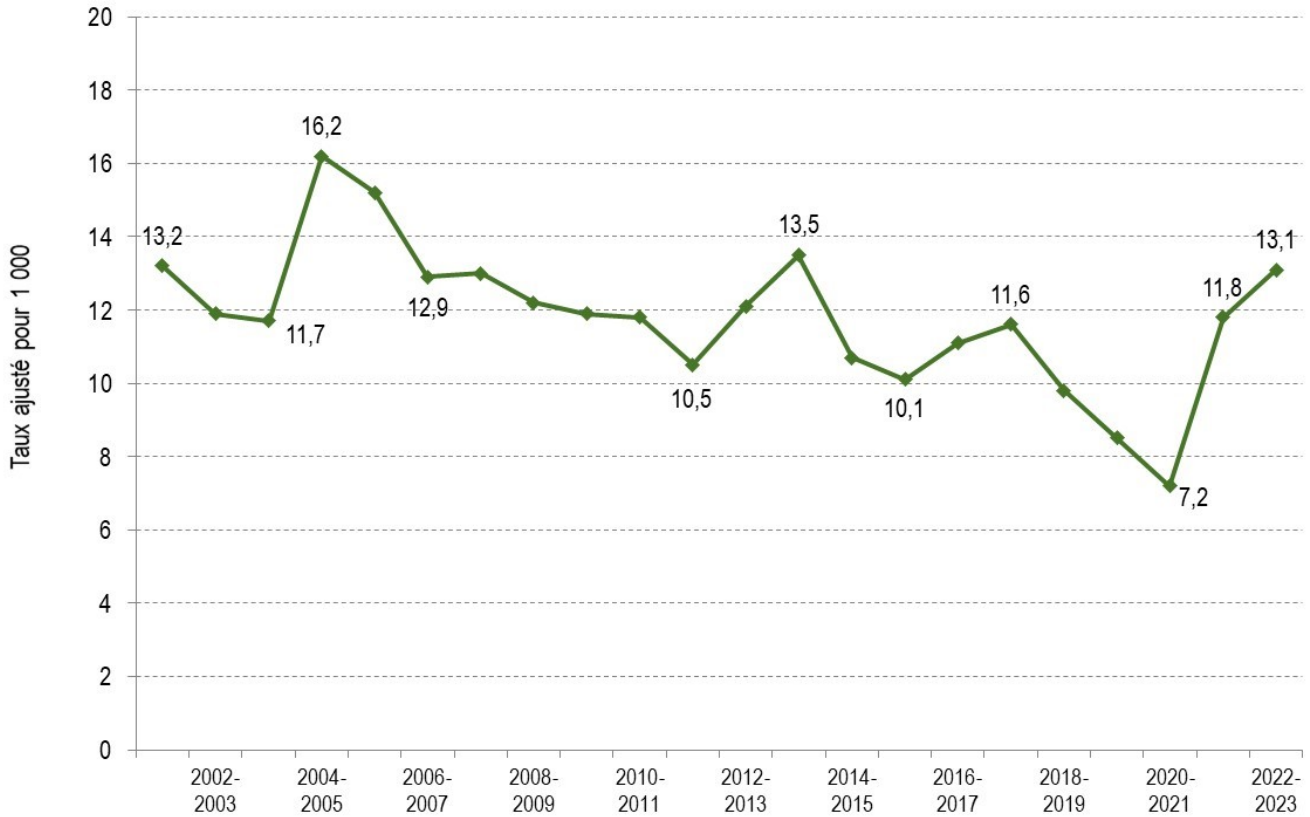
Taux d'incidence de la maladie pulmonaire obstructive chronique (MPOC) parmi la population âgée de 35 ans et plus, MRC de la Vallée-de-l'Or, 2001-2002 à 2022-2023