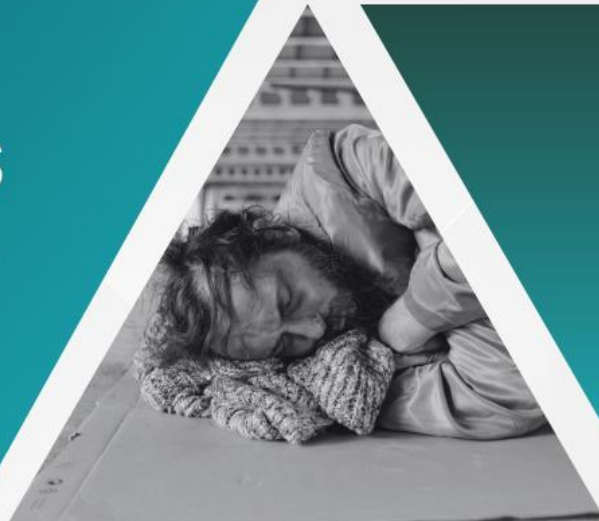
TABLEAU DES RESSOURCES PRISE EN CHARGE DES APPELS RELIÉS À L'ITINÉRANCE À ROUYN-NORANDA