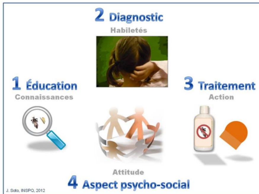
Figure 1 Axes d'intervention pour la prévention et le contrôle des poux de tête dans les écoles et les services de garde éducatifs à l'enfance